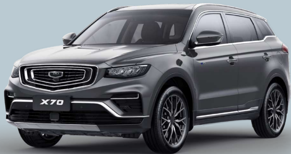
Titanium Grey Серый металлик