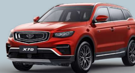
Flame Red Красный металлик