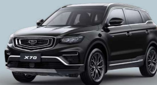
Ink Black Черный металлик