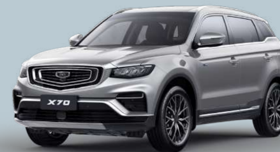
Pearl Silver Серебристый металлик