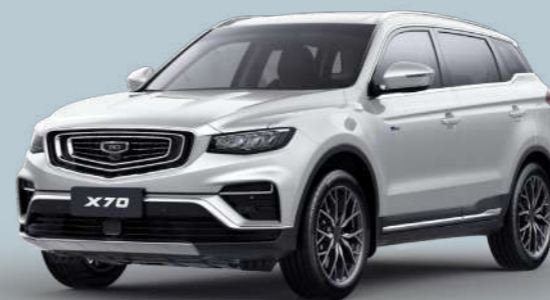
Crystal White Белый