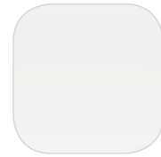
Белый ICY WHITE акрил