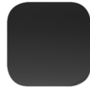
Черный NOIR PERLA металлик