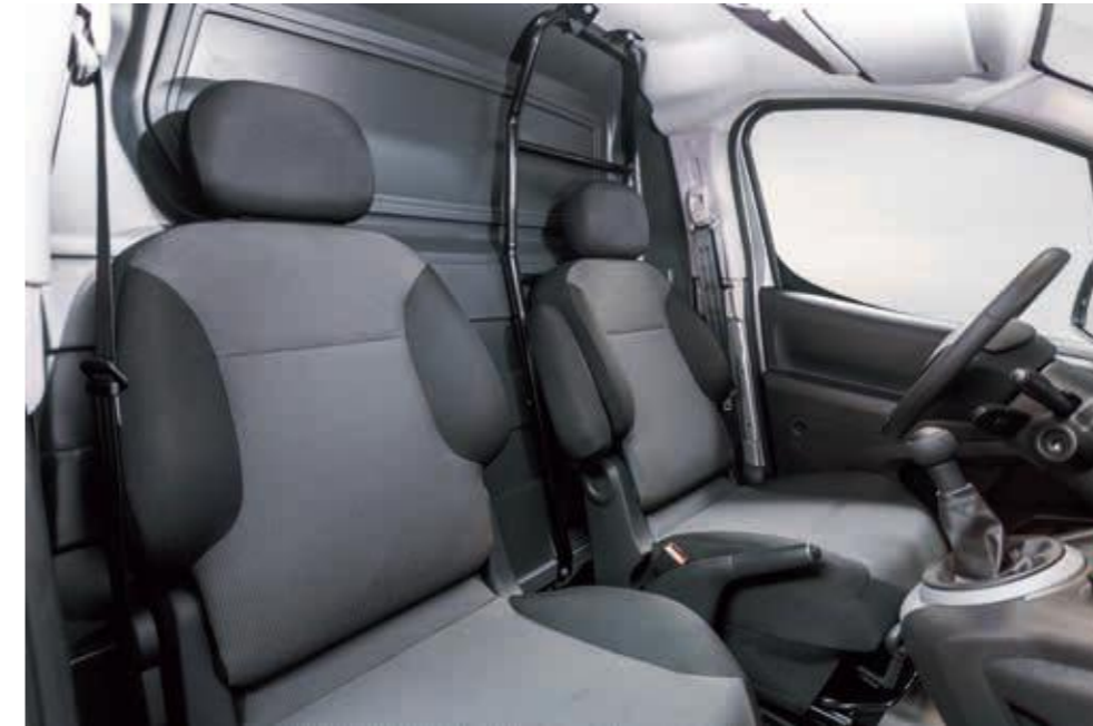
Тканевая обивка Tissu Mica Grey