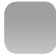
Серебристый GRIS ALUMINIUM металлик