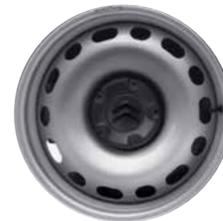
Штампованный стальной диск