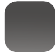
Серый GRIS SHARK металлик