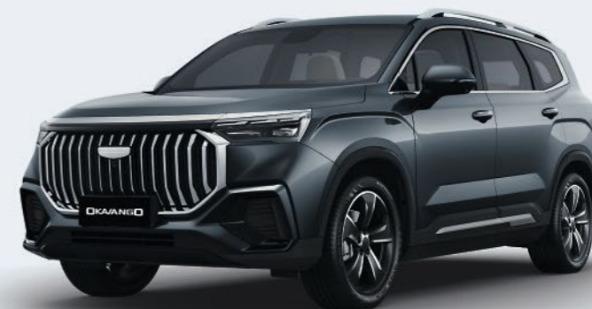
Basalt Gray Серый металлик