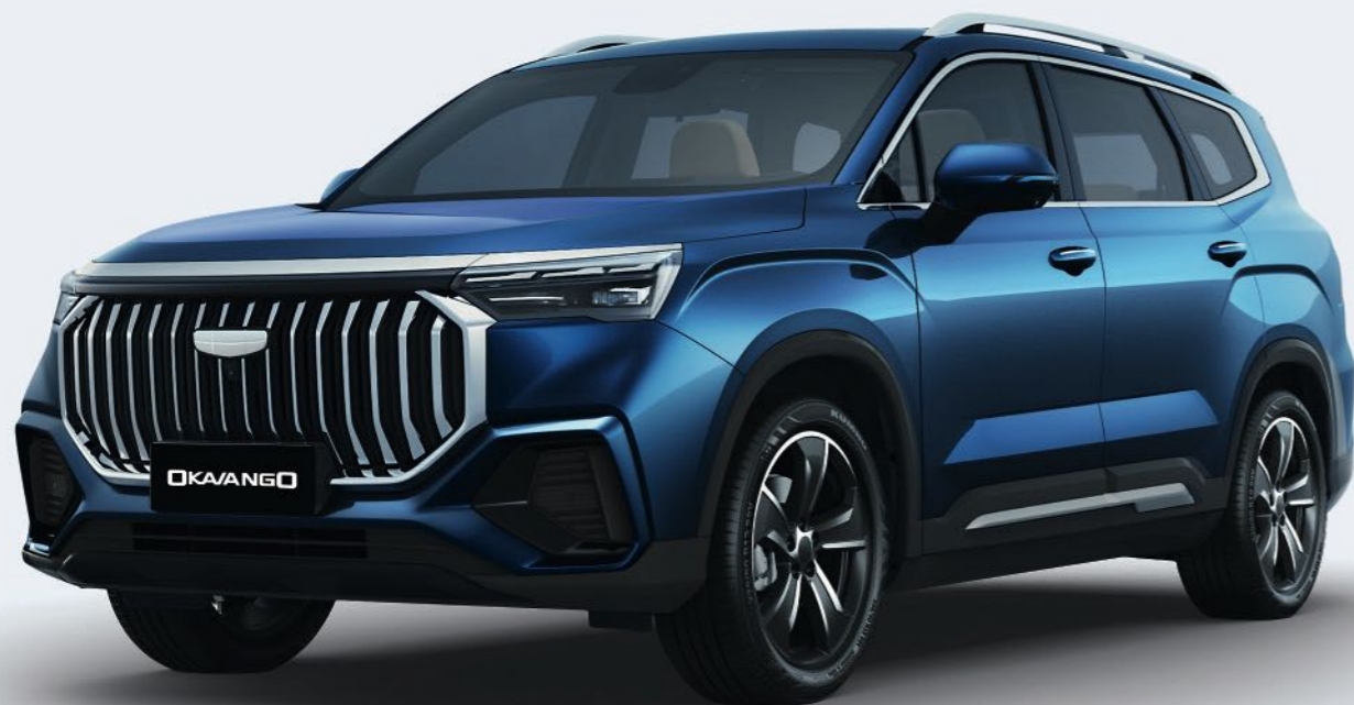
Indigo blue Синий металлик