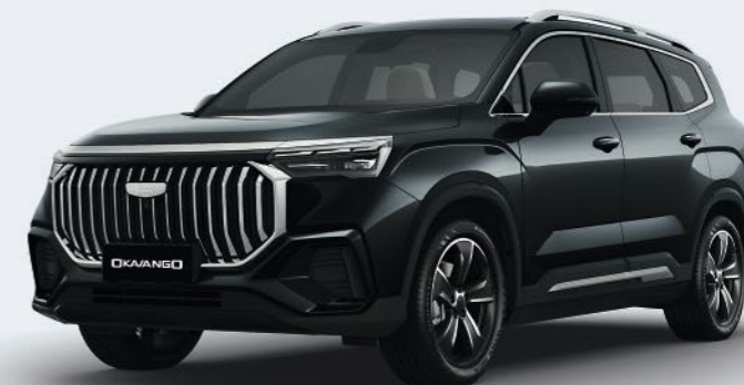
Ink Black Черный металлик