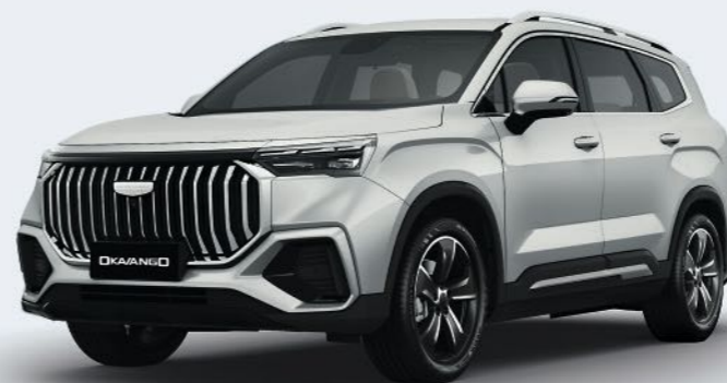
Crystal White Белый