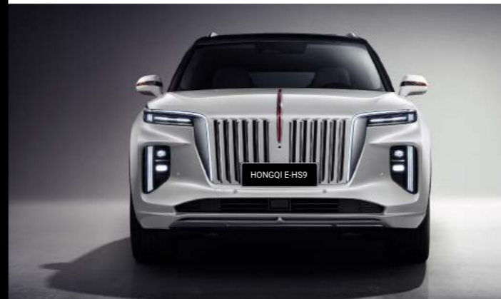
Квантовый серебристо-серый Quantum silver-grey