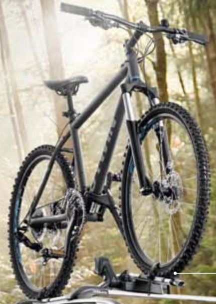
ДЕРЖАТЕЛЬ ДЛЯ ВЕЛОСИПЕДА