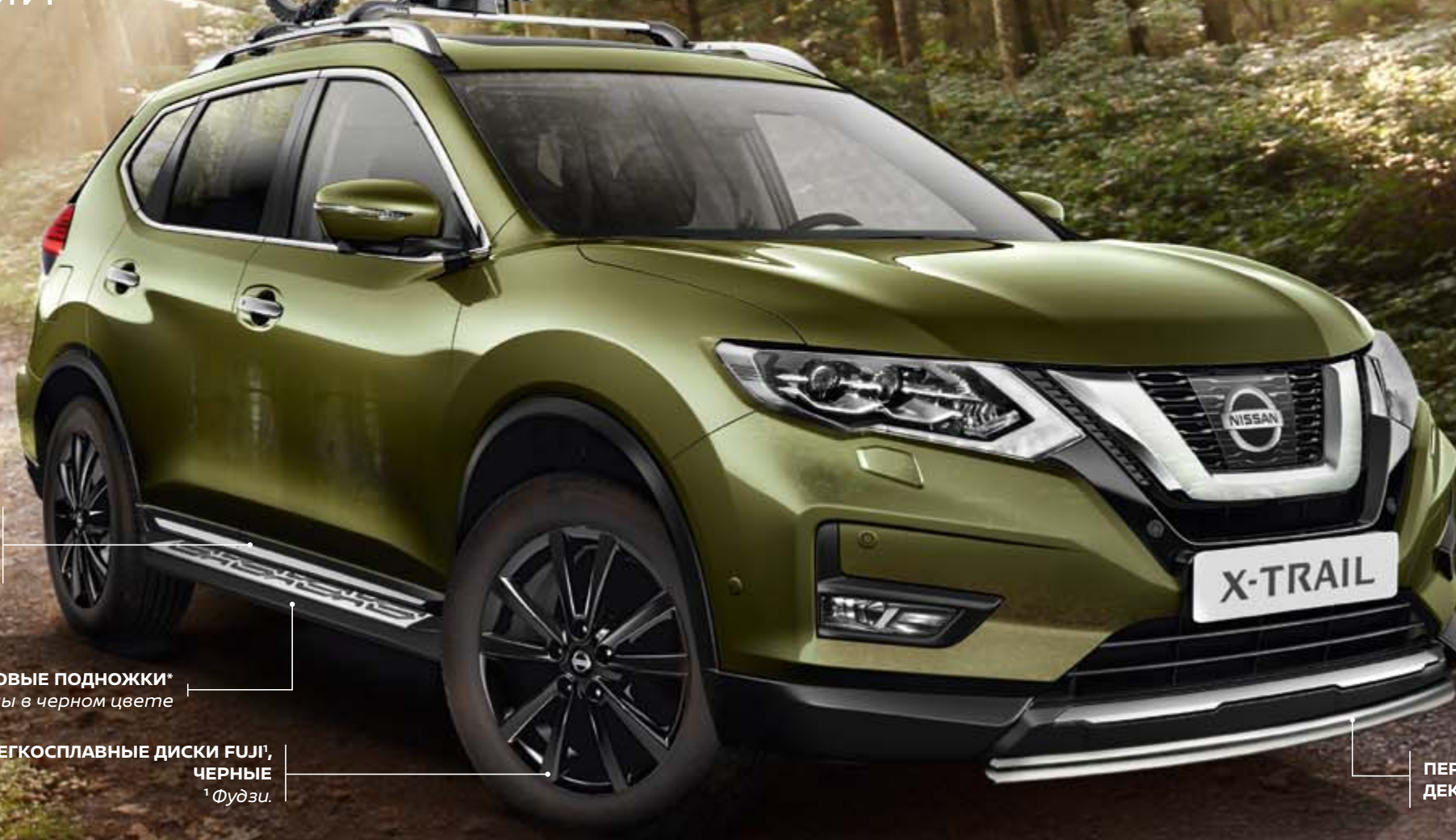
ПЕРЕДНЯЯ ДЕКОРАТИВНАЯ ДУГА