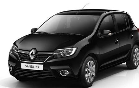
ЧЕРНАЯ ЖЕМЧУЖИНА (NV 676)