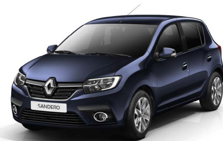
СИНИЙ САПФИР (TE RPG)