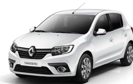
БЕЛЫЙ ЛЕД (OV 369)