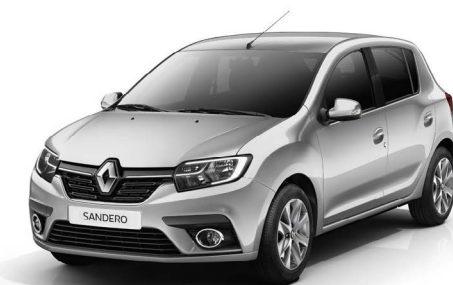
СЕРАЯ ПЛАТИНА (TE D69)