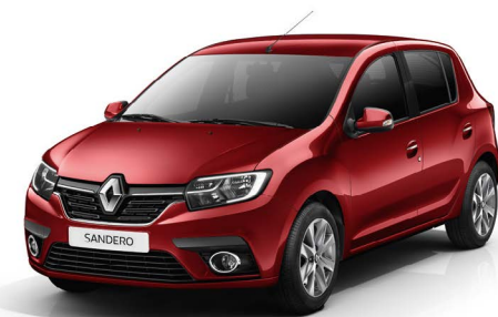
КРАСНЫЙ (TE NPI)