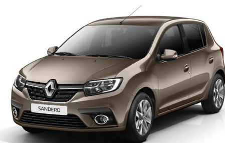
КОРИЧНЕВЫЙ (TE CNM)