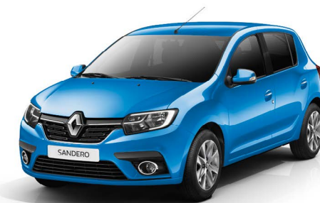
ЛАЗУРНО-СИНИЙ (TE RPL)