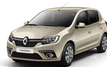
СВЕТЛЫЙ БАЗАЛЬТ (TE KNM)