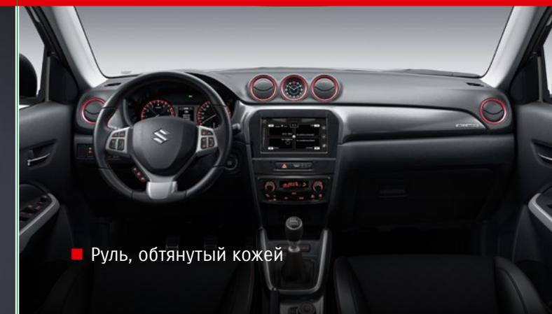
■ Руль, обтянутый кожей