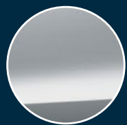
Silky Silver Metallic